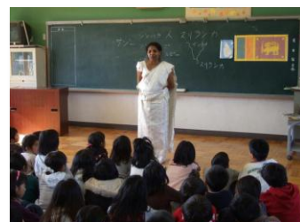
中川小国際理解集会の様子