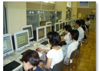
パワーポイント研修会の様子