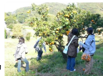
のぞみ学級の活動