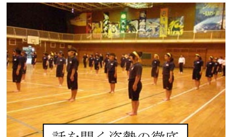
話を聞く姿勢の徹底

どの学校も生徒が目だけではなく、耳も心を傾けるよう指導されていて、個々の責任感や、相手を尊重する気持ち、集中力を体現していました。「聴くこと」は、役割の遂行、安全、協力…等、学ぶ基本であり、生きる力の根幹だと再確認しました。