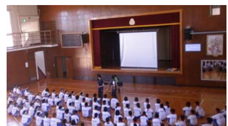
他校の演舞から学ぶ（価値判断）

活動時間を充実させるため、わずか3分程度の時間でしたが、個々の心に「共に高めあう、共にうまくなる」という意識を刻むという小さな積み重ねが、交流会大成功という大きな成果を生んだのだと思えます。