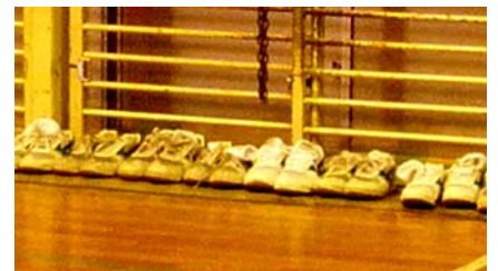
常に靴を揃えることへの意識づけ